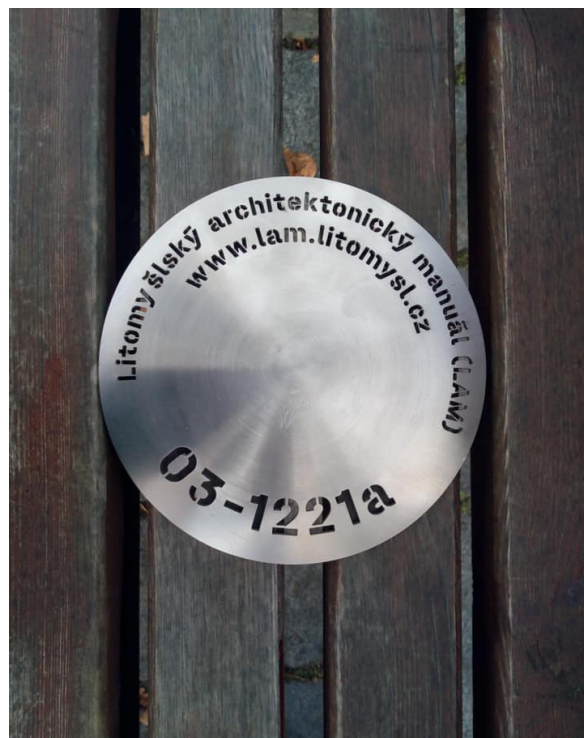
Obr. 2 Kovová destička pro označení objektů „in situ“ – nese název a webovou adresu projektu LAM a kód příslušného objektu (sestává z čísla stezky a čísla popisného).