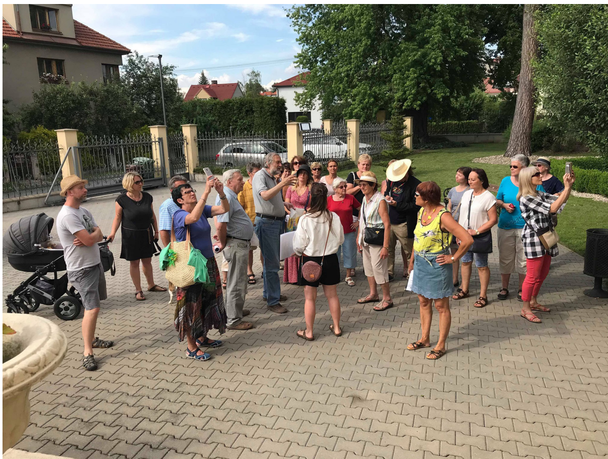
Obr. 4 Návštěva tzv. vily Grácie v rámci doprovodného programu LAM „Procházky (s) městem“.

Ideovým a metodickým vzorem byl také druhý předchůdce LAMu – Plzeňský architektonický manuál (PAM). 12) Oproti Brnu a Plzni však LAM do svých tras zařadil i architekturu současnou, na jejíž kvalitu je v Litomyšli dlouhodobě kladen zřetel a v databázi nesměla chybět.